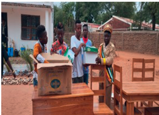
Cerimónia de Entrega de Kits em Massingir