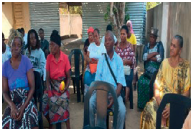
Líderes Comunitários e Membros da Comunidade na Cerimónia de Entrega de Material de Apetrechamento e Kits de Empreendedorismo em Manjacaze