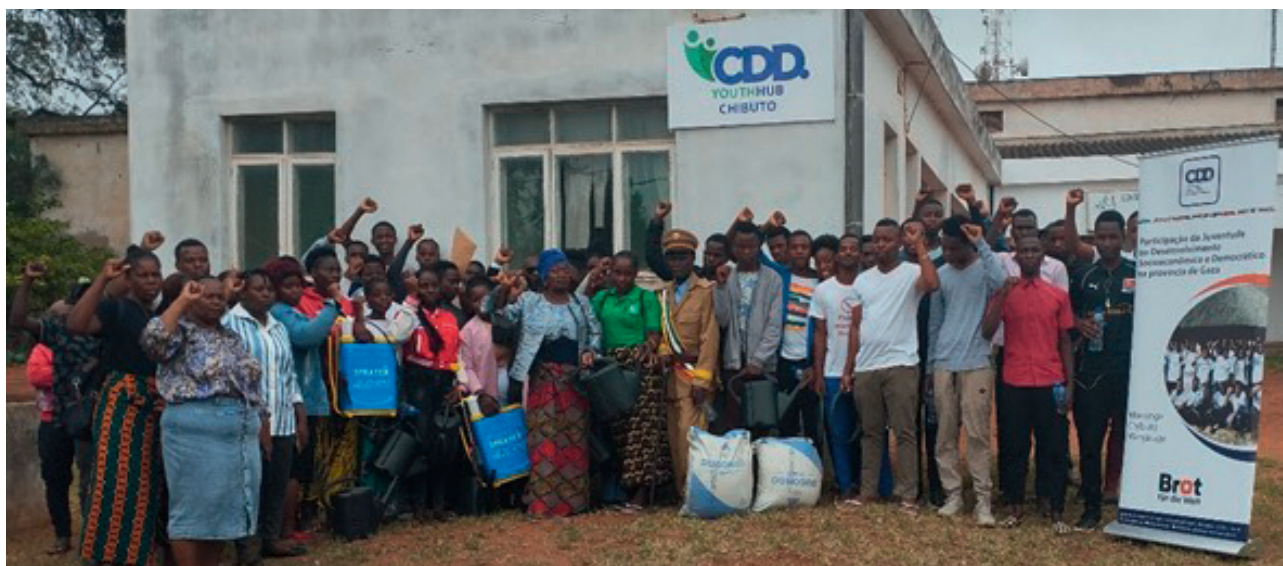
Cerimónia de Entrega de Material de Apetrechamento e Kits de Empreendedorismo

tecimento reuniu mais de 47 participantes, incluindo líderes comunitários, grupos juvenis e membros da comunidade, que atestaram positivamente esta iniciativa, que visa não só engajar os jovens, mas também promover o empoderamento dos jovens em prol do desenvolvimento local.