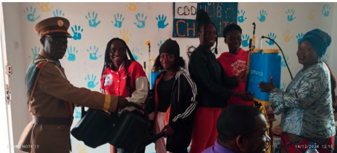
Figura 1: Cerimónia de Entrega de Material de Apetrechamento e Kits de Empreendedorismo em Chibuto