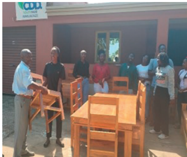
Cerimónia de Entrega de Kits em Manjacaze