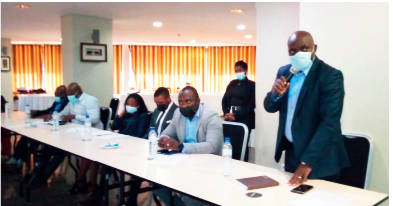
Primeira Reunião do Grupo de Coordenação Provincial, Niassa.

dos jovens, através de capacitações, empreendedorismo e engajamento cívico para que estes estejam menos propensos ao recrutamento para o extremismo violento.