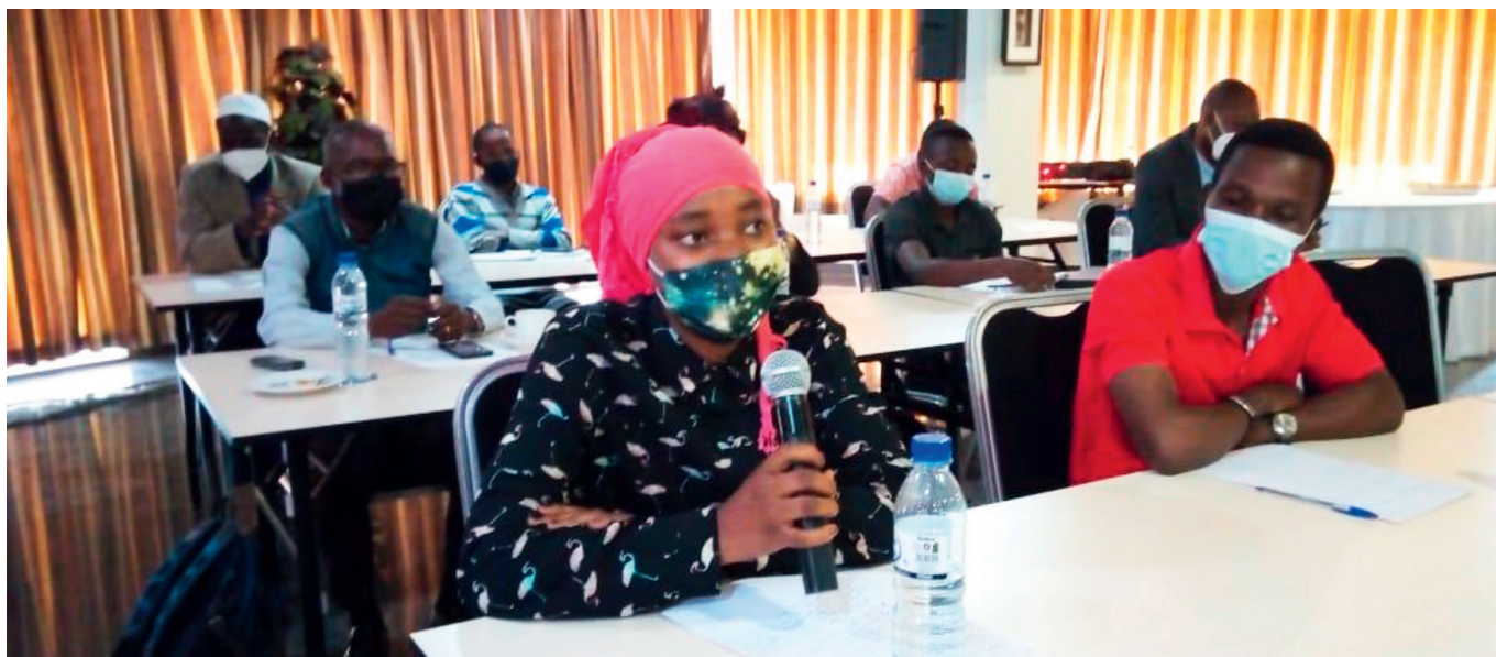
Primeira Reunião do Grupo de Coordenação Provincial, Niassa.

com a representação da Embaixada da Irlanda no Niassa, com a representação da Cooperação Alemã no Niassa e com a We Effect . Estes encontros visavam identificar as linhas de intercessão entre o Programa de Coesão Social e outras iniciativas implementadas localmente.