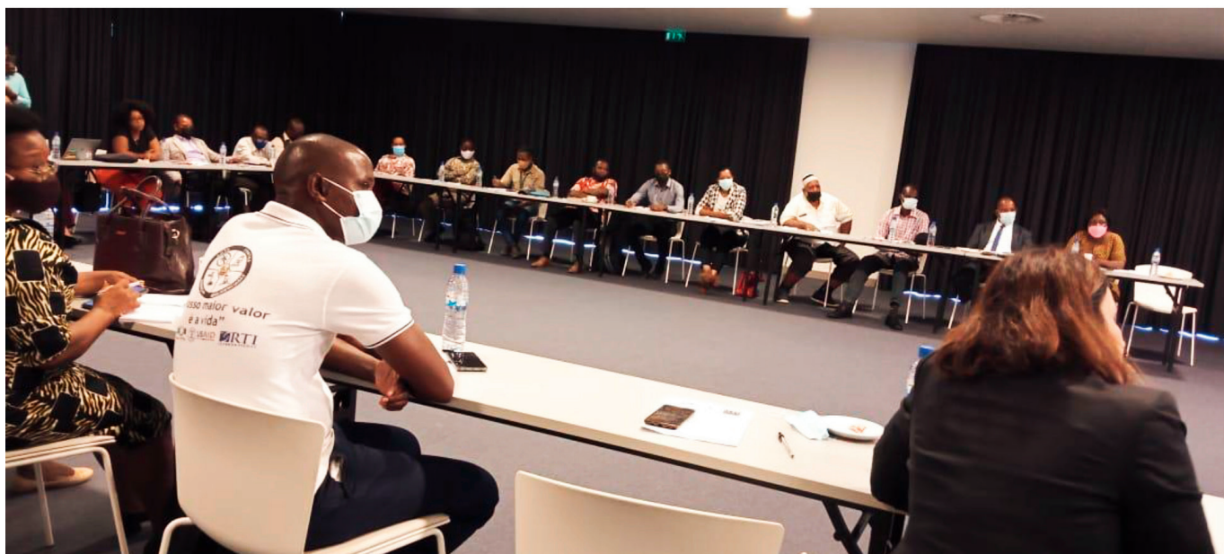
Primeira Reunião do Grupo de Coordenação Provincial, cidade Pemba.