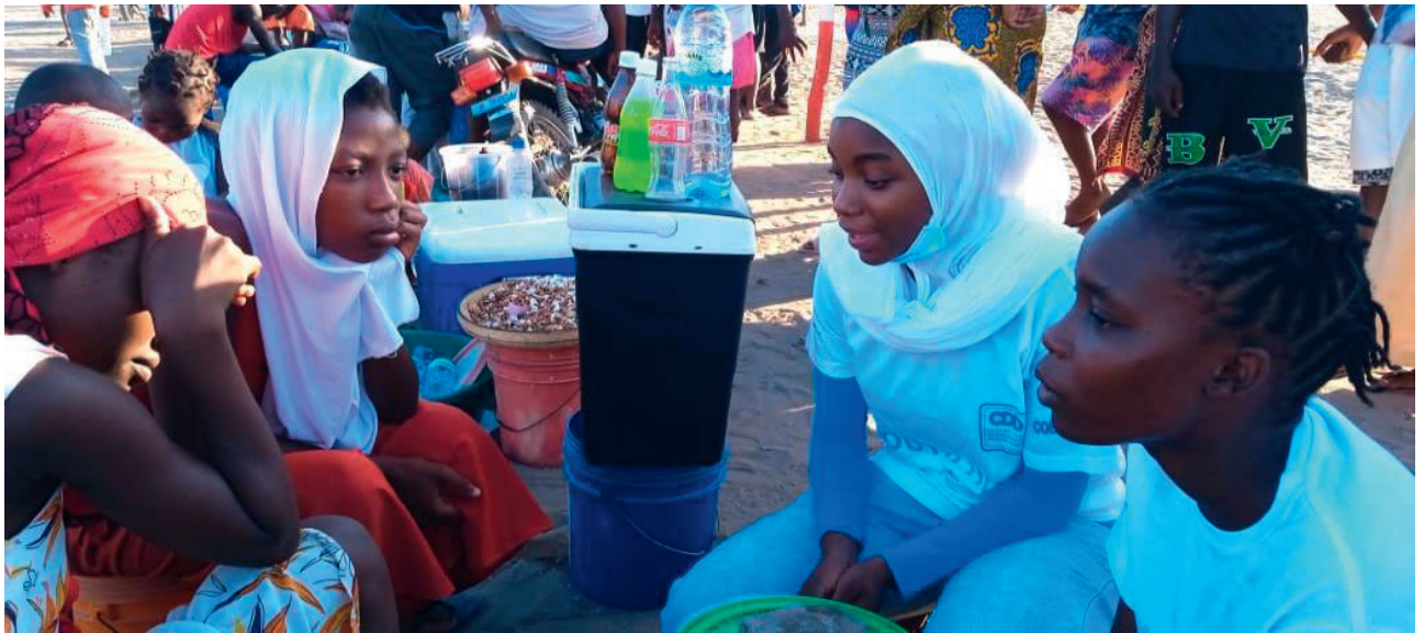
Sensibilização sobre Higiene Menstrual, Youth Hub de Pemba.