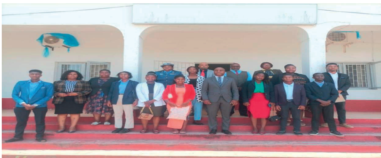
Participação do Youth Hub de Manjacaze na XI Sessão Ordinária do Governo do Distrito