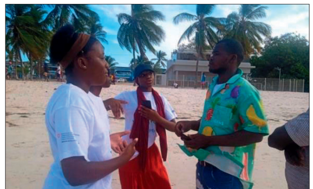
Sensibilização sobre Saúde Sexual e Reprodutiva na Praia do Wimbe, Youth Hub de Pemba, Cabo Delgado