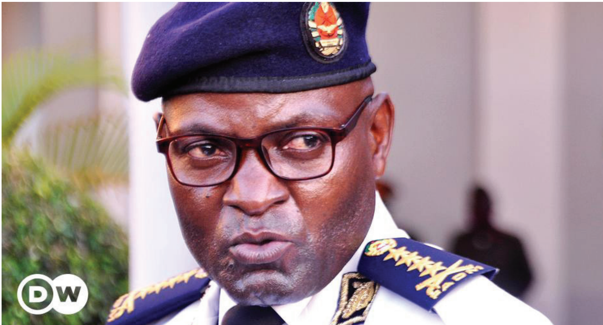
Almirante Joaquim Mangrassa, Chefe do Estado-Maior General das FADM

Os seis sargentos - quatro afectos ao Estado-Maior General das FADM e dois à Força Aérea de Moçambique – foram detidos no dia 7 de Maio e permaneceram três dias nas celas do Estado-Maior General das FADM, de onde foram transferidos para as celas do Comando da Polícia Militar, na Cidade de Maputo, no dia 10 de Maio. Neste momento, correm processos disciplinares visando a expulsão dos sargentos, conforme garantiu uma fonte oficial ao Integrity Magazine.