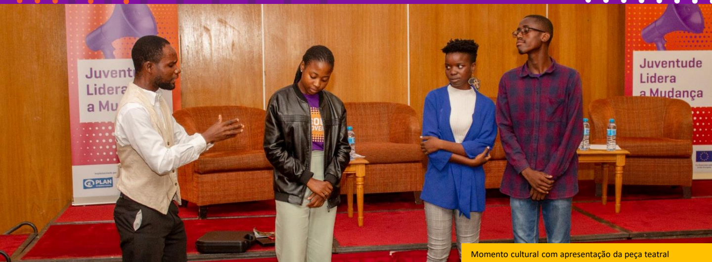
Momento cultural com apresentação da peça teatral

Houve um momento cultural onde jovens apresentaram uma peça de teatro que explorou temas relacionados com os desafios que a juventude enfrenta no seu processo de afirmação social e política. Foi um momento de descontração e também de reflexão para todos os presentes.