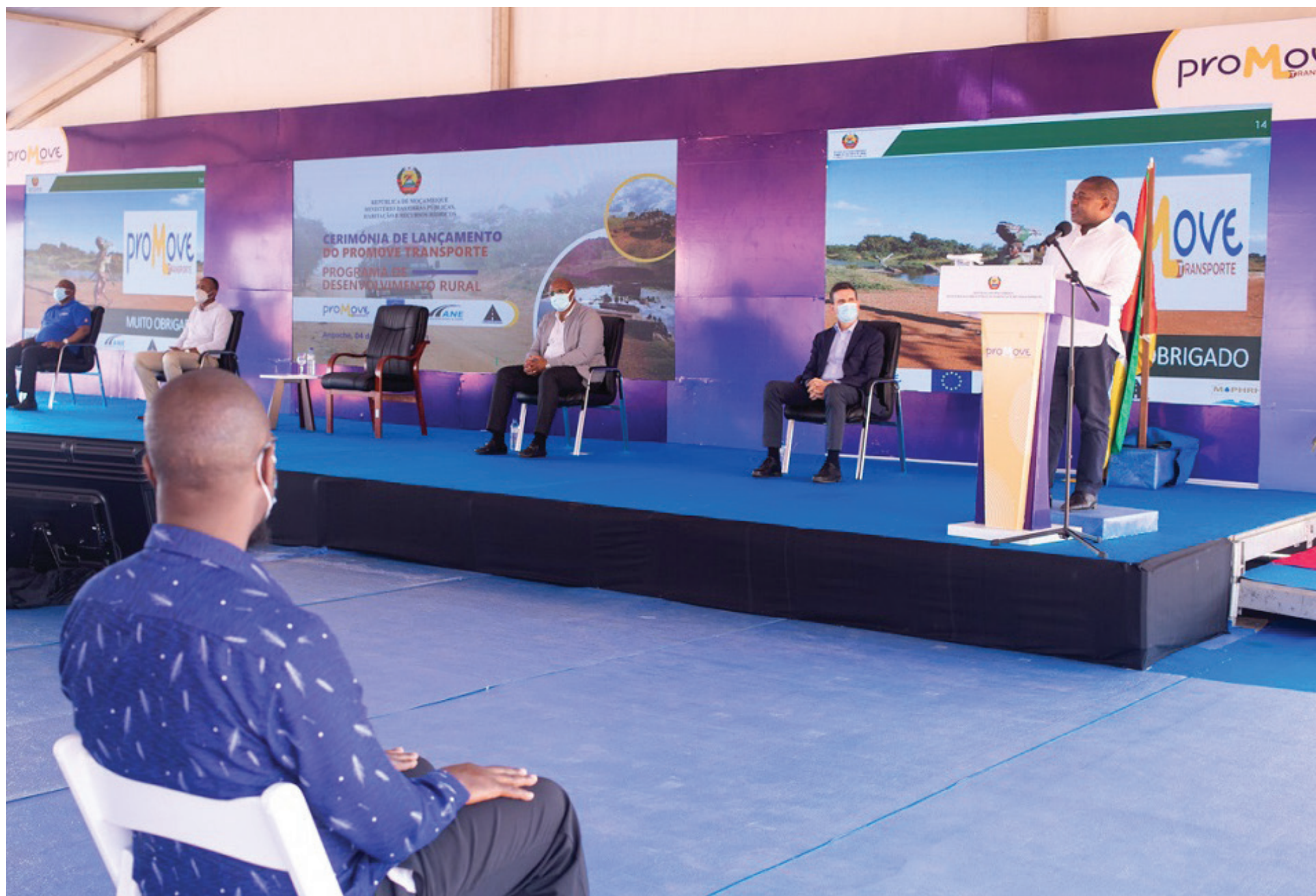
Filipe Nyusi no lançamento do projecto Promove Transporte, que inclui a estrada Nametil - Angoche