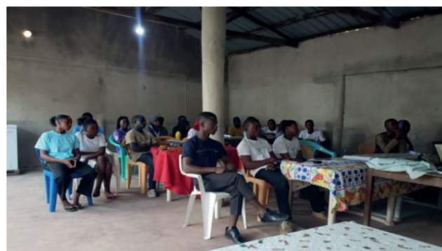
Sessão de Enriquecimento Curricular de formação com Base nas Experiências dos Ex-Alunos do Youth Hub de Montepuez