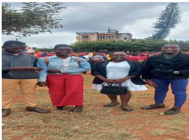
Participação do Youth Hub de Chibuto nas Cerimónias solenes alusiva a passagem do dia da Paz