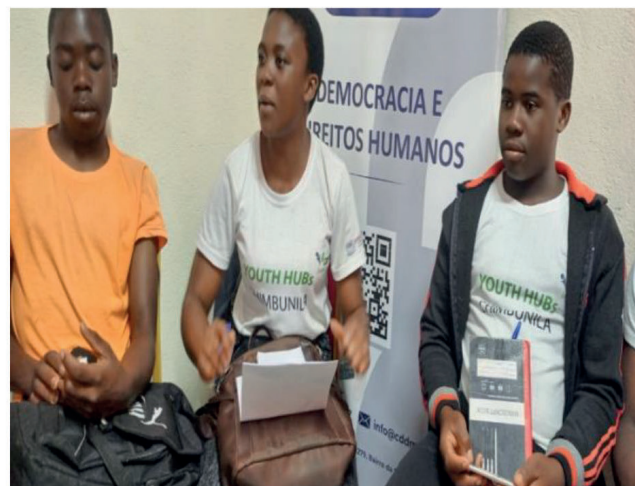
Actualização e Enriquecimento Curricular – Youth Hub de Chimbunila