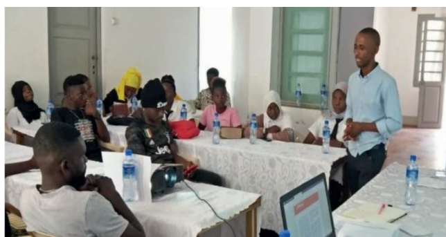
Workshop Distrital para Avaliação e Actualização do Currículo de Formação – YH Angoche