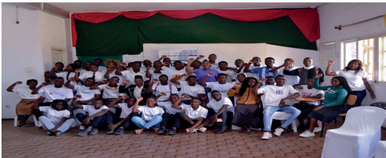
Sessão Académica para Actualização e Enriquecimento do Currículo do Youth Hub Baseado nas Experiências de Ex-Alunos

Esse processo de escuta e integração das experiências dos ex-alunos representa um compromisso contínuo do Centro de Jovens de Cuamba em promover uma formação que responda de maneira eficaz às realidades locais, preparando a próxima geração de jovens para serem agentes de transformação nas suas comunidades.