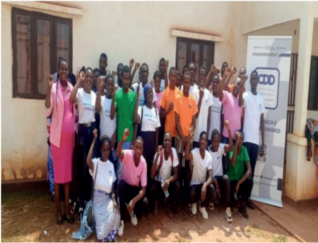
Encontro de Actualização Curricular com Participação de Ex-Alunos do YH de Moma