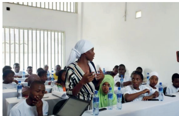
Sessão de Enriquecimento Curricular de formação com Base nas Experiências dos Ex-Alunos do Youth Hub de Montepuez