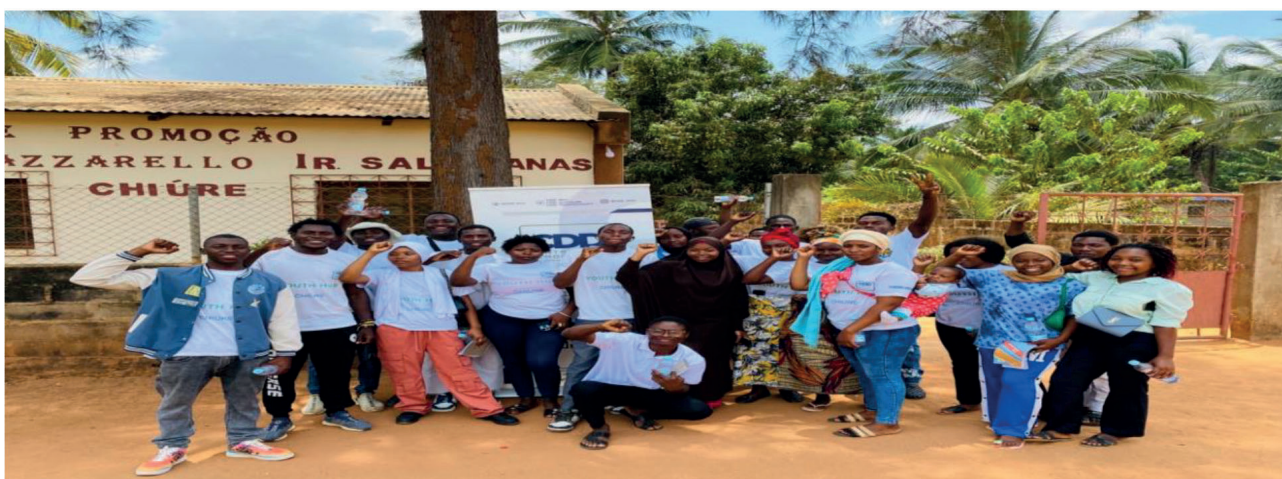
Sessão para Revisão e Actualização do Currículo – Youth Hub de Chiure