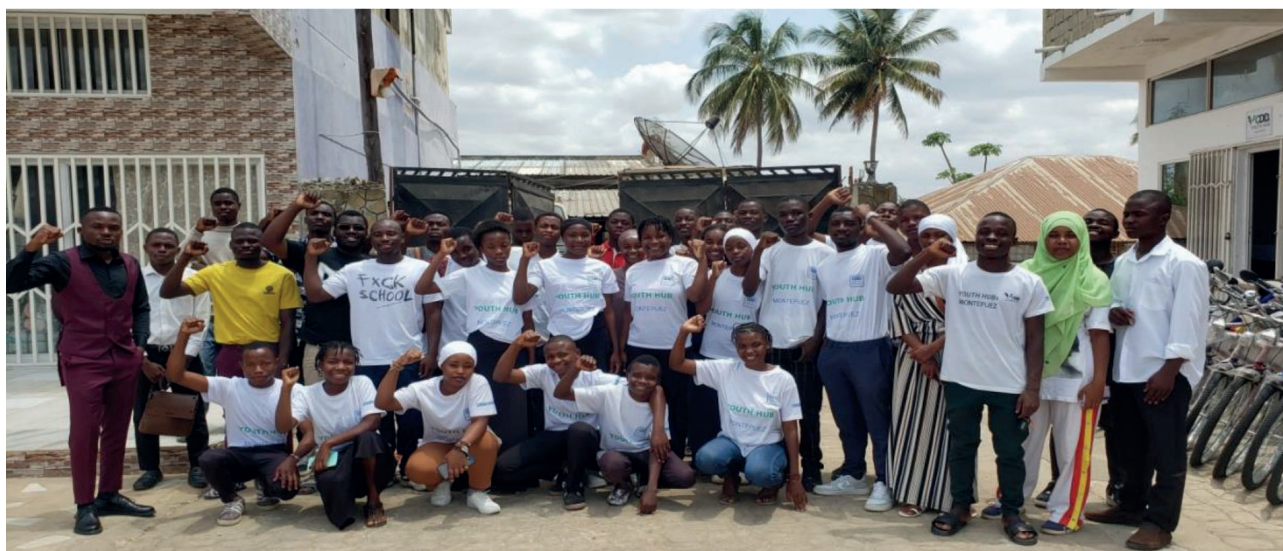
Foto família dos Alumni's participantes da Sessão de enriquecimento do currículo em Montepuez

Ao final das discussões ficou evidente o consenso entre os participantes de que o currículo deve evoluir constantemente, adaptando-se às novas demandas e capacitando os jovens a se tornarem líderes transformacionais e agentes de mudança nas suas comunidades. A sessão foi, portanto, um passo significativo no fortalecimento do Youth Hub como um espaço dinâmico de aprendizagem e transformação social.