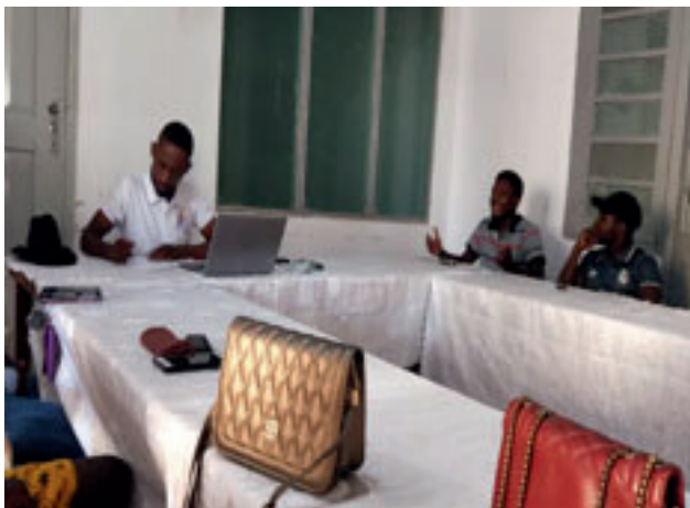
Sessão de Monitoria dos Projectos NEXGEN com os Gestores Mutuários em Angoche

O encontro permitiu traçar estratégias resilientes para o funcionamento, buscando colher diferentes sensibilidades dos grupos, buscando solucionar os desafios operacionais de cada mutuário.