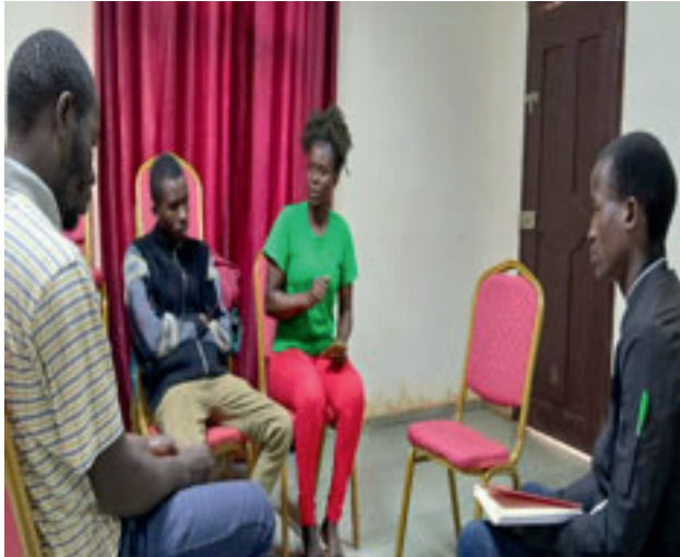
Encontro do Youth Hub com Jovens Gestores de Projectos em Chimburnila, Niassa