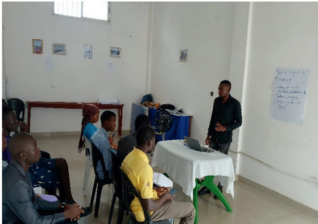
Encontro com os Gestores Mutuários do NEXGEN em Montepuez

lidade dos produtos. Contudo, destacaram a importância de apoio técnico adicional e capacitações específicas para enfrentar os desafios identificados. A reunião foi proveitosa, permitindo um diálogo aberto e construtivo com os beneficiários. O compromisso de todos os envolvidos reside na superação dos desafios e no alcance dos objectivos estabelecidos, reforçando a confiança no sucesso dos projectos de empreendedorismo.