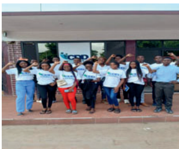
Encontro de Planificação Anual do Youth Hub de Cuamba, Niassa