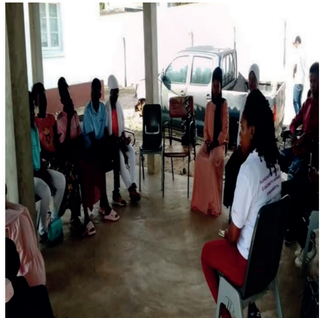
Debate sobre o Cancro da Mama, Youth Hub e SDSMAS de Angoche