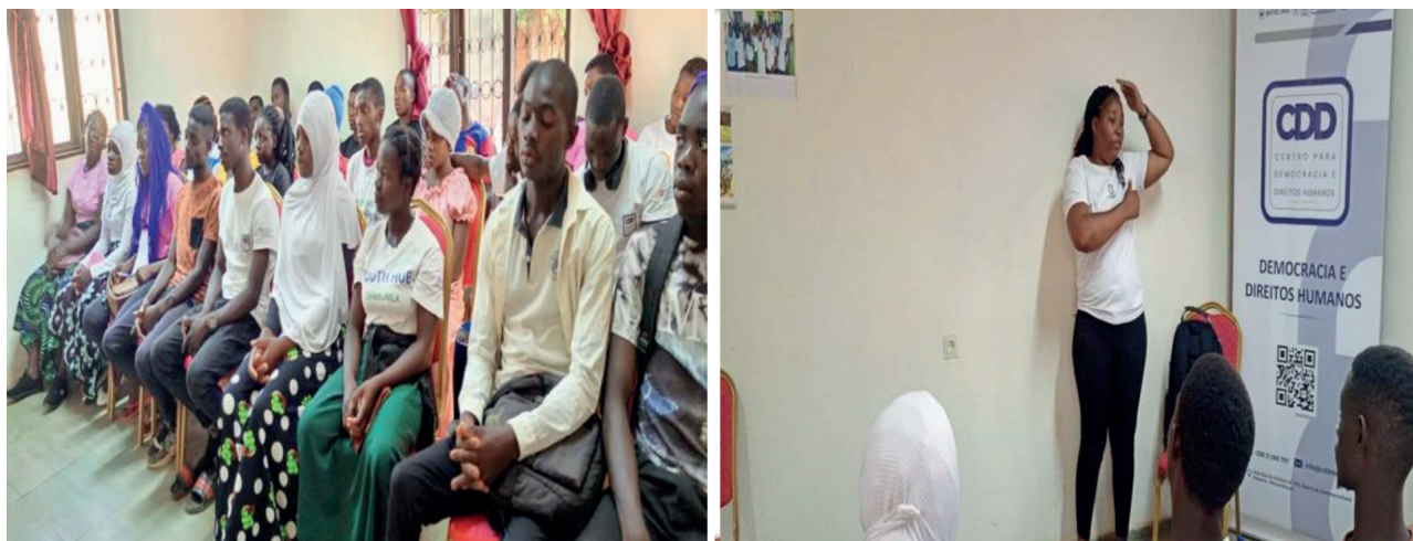
Debate sobre o Cancro da Mama, Youth Hub de Chimbunila