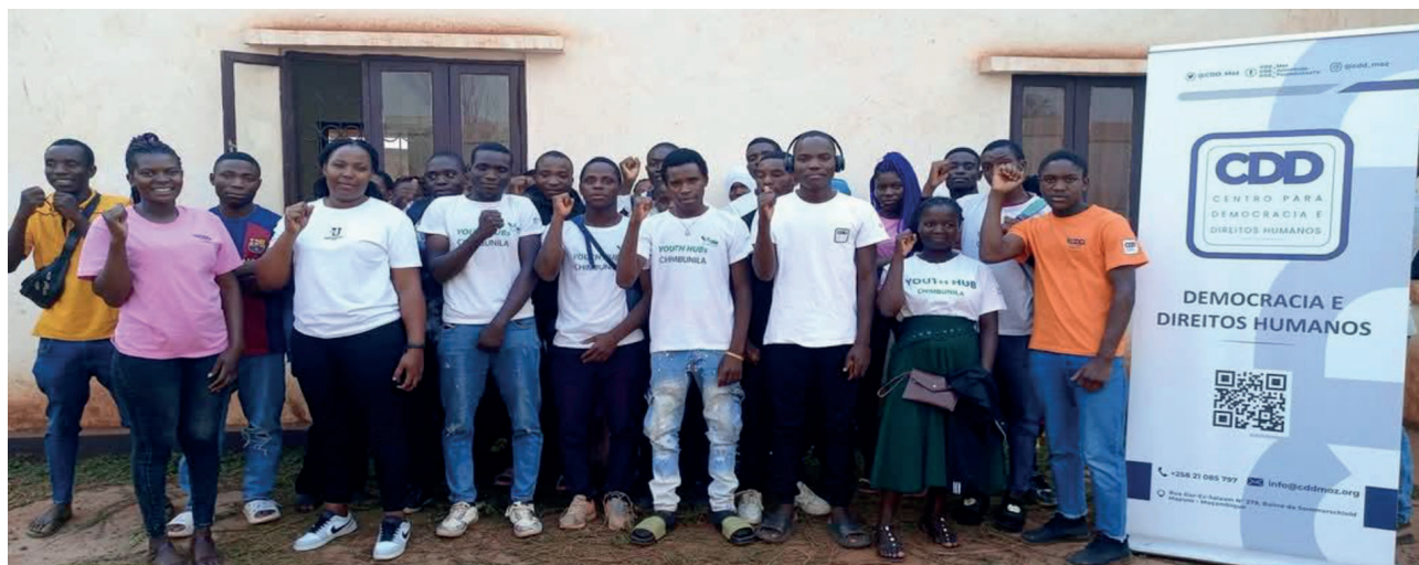
Foto Família dos Jovens participantes do Debate

Com ações como essa, o Youth Hub de Chimbunila reafirma o seu compromisso em ser um catalisador de mudança positiva, promovendo educação em saúde, empoderamento juvenil e coesão social nas comunidades locais.