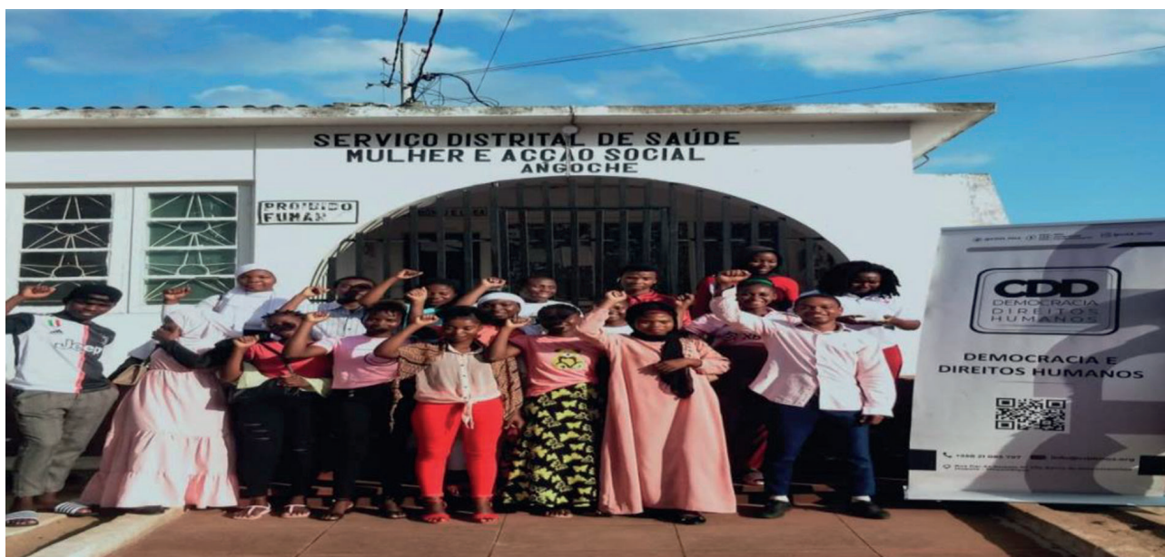
Foto Familiar dos participantes do Debate sobre Outubro Rosa