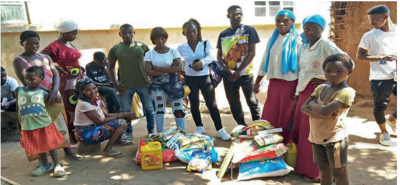
Entrega de Cabazes às Famílias das Crianças órfãs e vulneráveis