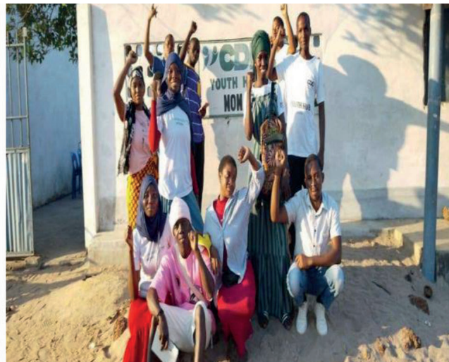
Debate juvenil sobre análise e reflexão sobre as actividades desenvolvidas no âmbito do Programa de Coesão Social, Youth Hub de Moma